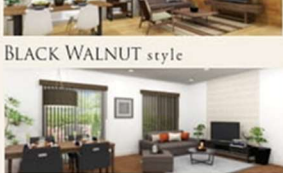
BLACK WALNUT style