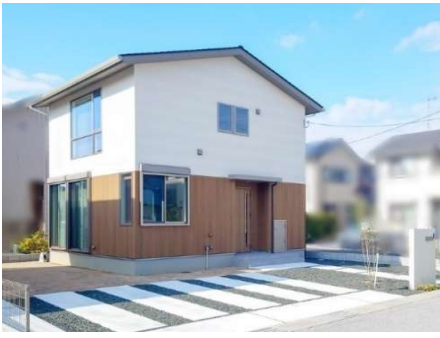
太陽光発電(3.6kW)、オール電化住宅