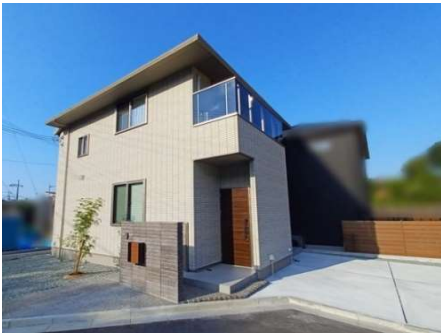
太陽光発電(2.88kW)、オール電化住宅