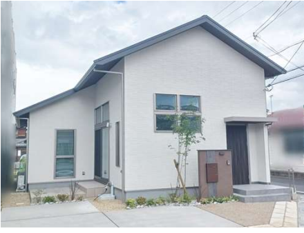
太陽光発電(4.8kW)、オール電化住宅、蔵のある家