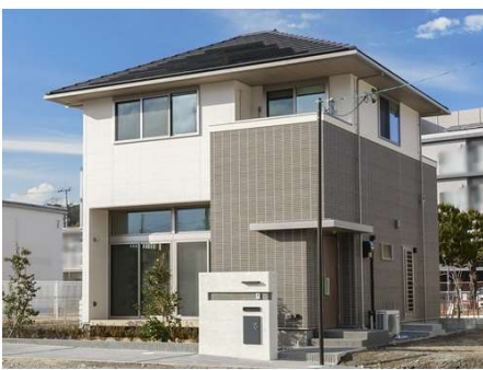
太陽光発電(2.89kW)、エネファーム