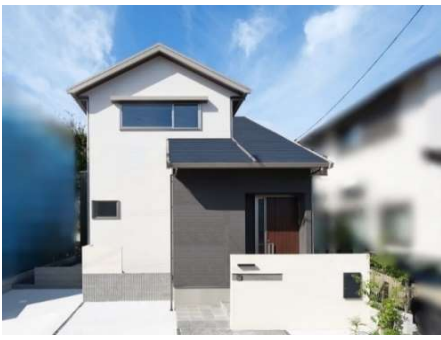
太陽光発電(2.96kW)、エネファーム、蔵のある家