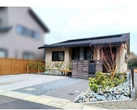
太陽光発電(5.03kW)、オール電化住宅、蔵のある家