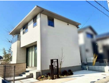
太陽光発電(2.5kW)、エネファーム