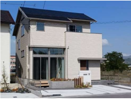
太陽光発電(3.49kW)、オール電化住宅、蔵のある家